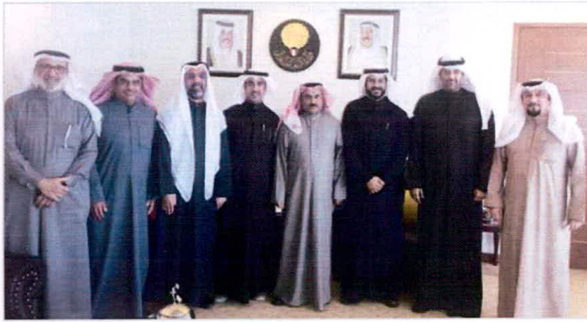
وزير التربية وزير التعليم العالي د.سعود الحربي متوسطا وفد رابطة هيئة تدريس كليات التطبيقي

■ أعرب رئيس رابطة أعضاء هيئة التدريس لكليات التطبيقية د. يوسف المنزي عن شكره لوزير التربية وزير التعليم العالي د. سعود الحربي على استقبله لوفد الرابطة في مكتبه أول من أمس وتفهمه لكل المطالب التي طرحت خلال اللقاء الذي تناول أيضا العديد من القضايا الأكاديمية المتعلقة بإسنادة الكليات التطبيقية التي شهدت توافقا في الروى وتفاعلا إيجابيا.