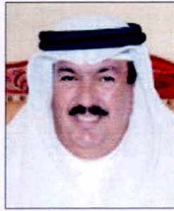
• علي المصنف